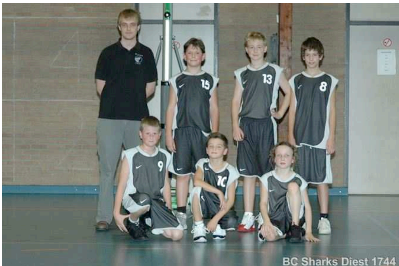
BC Sharks Diest 1744